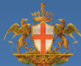
Comune di Genova