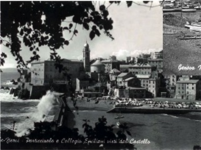
Genova Nervi - Porticciolo e Collegio Emiliani visti dal Castello