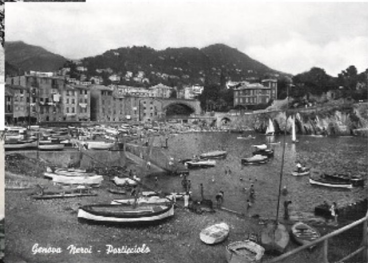
Genova Nervi - Porticciolo