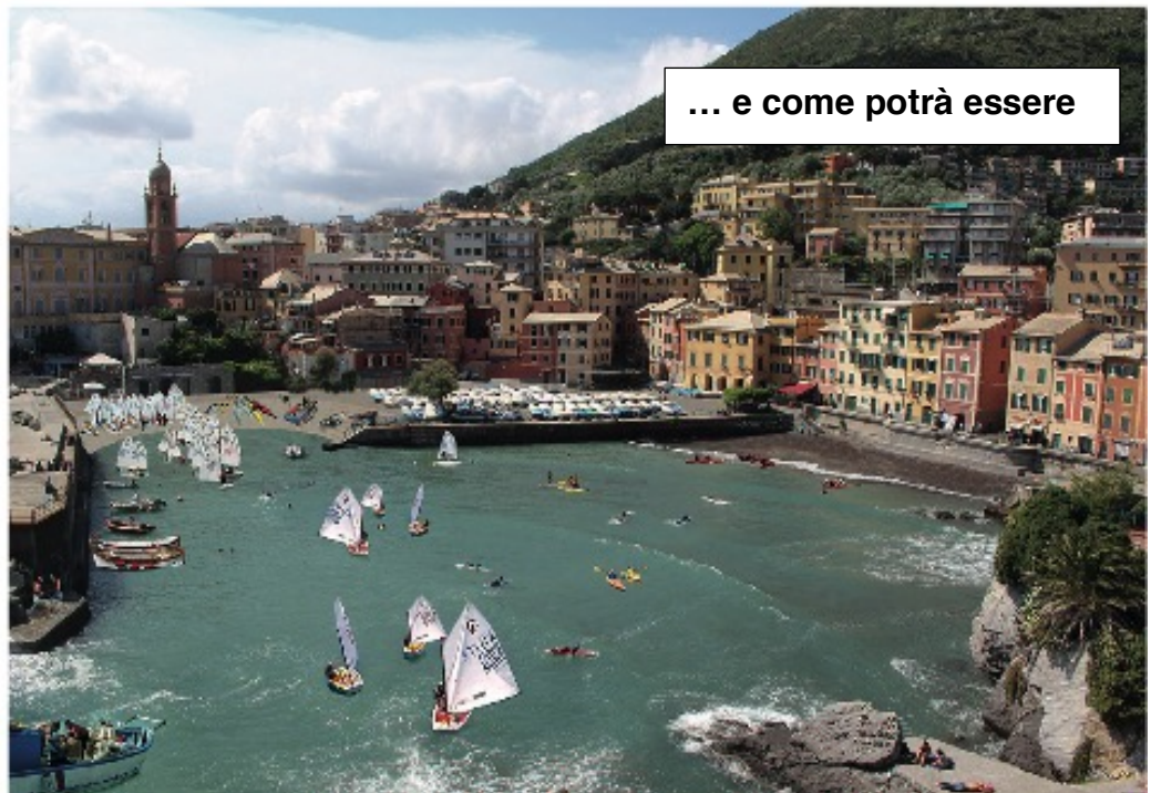
... e come potrà essere